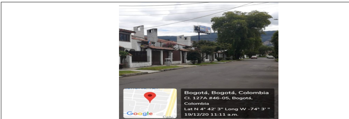
Foto 1. Vista panorámica del predio y de la valla ubicada en la Calle 127 A No 45 - 08 (dirección catastral) orientación Sur - Norte